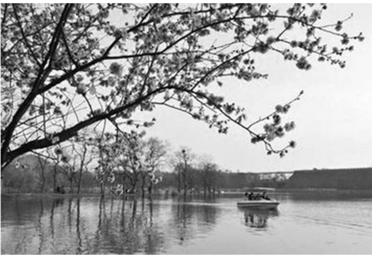
钟山植物博览园一瞥

植物博览园水陆面积达68公顷（1020亩），其中的森林休闲区、岩石园，我们尚未涉足，前湖南岸也未游个究竟。博览园中有个小货亭，旁边的几个凉篷下，摆放着数张桌凳；在右侧草地上，两排彩色小风车总是不辞辛劳地迎风飞舞。前两年，附近的丛林中常见到有穿迷彩服的少年在林间展开模拟枪击活动，增添了园中的热闹气氛。近两年，博览园内再也见不到出租场地（从事拍摄婚纱照、模拟枪击活动等）的商业行为了。在我们看来，这样也好，落得个纯洁无瑕。有赋云：“陶醉其间，心肺双清，神畅气爽，俗坐顿消，诗意激昂。”（见《中山植物园赋》）还是让我们张开臂膀，尽情拥抱这份繁翁郁的植物世界吧。