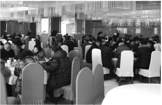
2018年老同志迎春团拜会

加强学习，也是为了增强执政本领。我们党是领导十三亿多人的执政党，党的领导千部更需带头学习，“以其昏昏，使人昭昭”，是不能担当领导改革开放和社会主义现代化建设事业重任的。在新的形势和任务面前，领导干部既要认真学习马克思主义理论，也要学习社会主义现代化建设的有关知识，还要学习中国历史和世界历史，特别是近代史和现代史。现在互联网这样发达，要学会并善于运用互联网技术和信息化手段开展工作。十九大报告在“全面加强执政本领”中提到，党员领导干部要增强七种本领，这就是：政治领导本领、改革创新发展本领、依法执政本领、群众