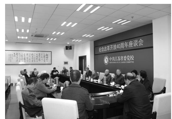
我校老同志理论组“纪念改革开放40周年座谈会”纪要