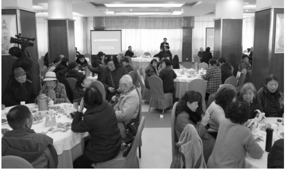
2019年老同志迎春团拜会